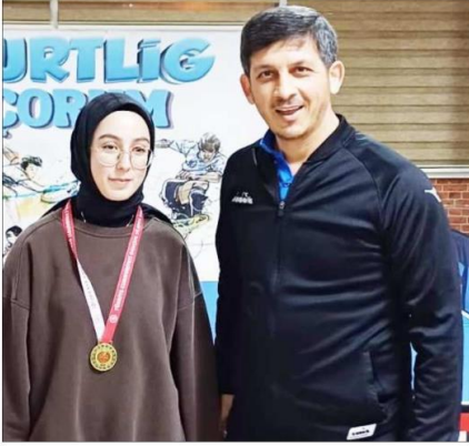
Dereceye giren sporcular madalya ile ödüllendirildi.